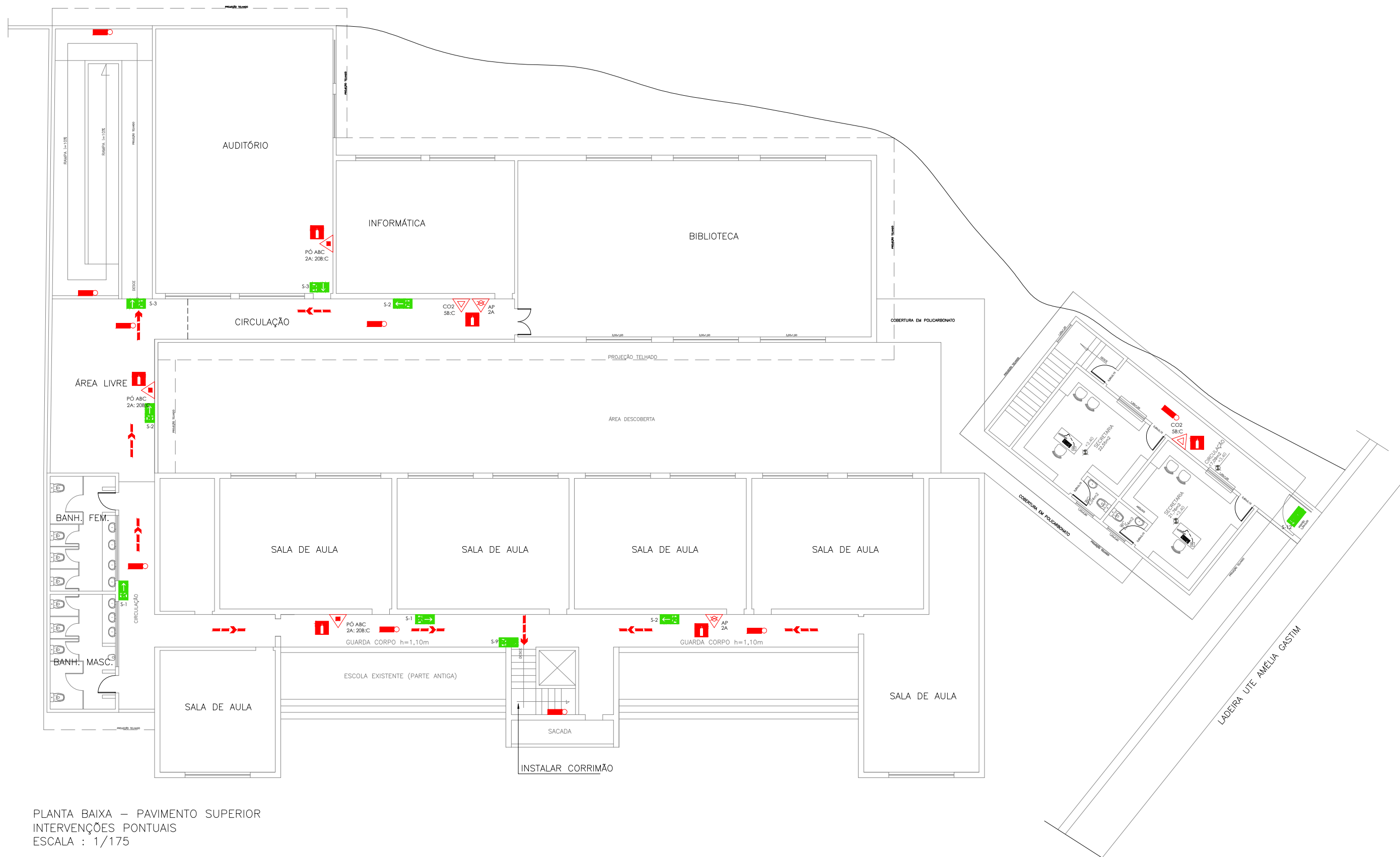
PLANTA BAIXA – PAVIMENTO SUPERIOR INTERVENÇÕES PONTUAIS ESCALA : 1/175

OBSERVAÇÕES: -VERIFICAR MEDIDAS NO LOCAL; -MEDIDAS EM METROS; -QUAISQUER DÚVIDAS/DIVERGÊNCIAS EM PROJETO CONSULTAR A FISCALIZAÇÃO ANTES DE QUAISQUER EXECUÇÃO.